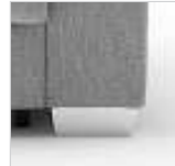
für Armlehnen Nr. 4 und Longchair

Trapezfuß Holz: Antik dunkel Nr. 706 Buche natur Nr. 707 Buche schwarz Nr. 708 Buche silberfarbig Nr. 709 Eiche natur Nr. 710