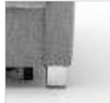
für Armlehnen Nr. 2, Longchair und AL 6 (Sessel)

Winkelfuß Metall: Schwarz matt Nr. 341 Chrom Nr. 347