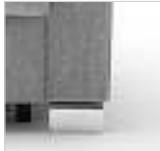
für Armlehne Nr. 1 und Longchair

Winkelfuß Metall: Schwarz matt Nr. 694 Chrom Nr. 693