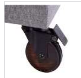
Rollenfuß für Hocker

Buche natur Nr. 371 Antik dunkel Nr. 373 Buche schwarz Nr. 374 Buche silberfarbig Nr. 375