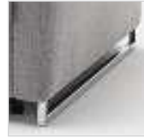
für Armlehne Nr. 3

Kufe: Chrom Nr. 702 Schwarz matt Nr. 703