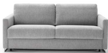
Armlehne Typ 3 mit Kufe