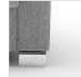
für Armlehnen Nr. 5 (Sessel)

Winkelfuß Metall: Schwarz matt Nr. 696 Chrom Nr. 695