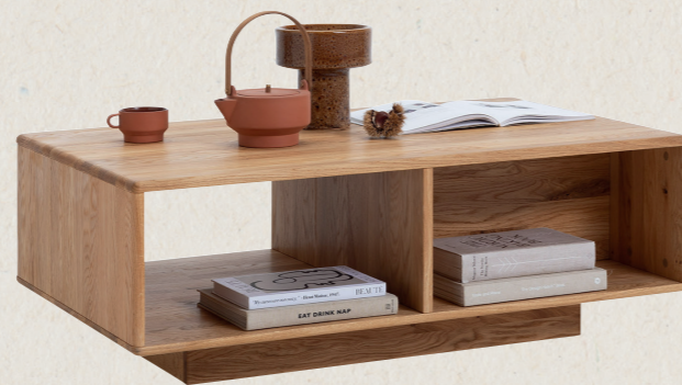
Verschiedene Wohnmöbel erhältlich Natürlicher Stauraum für Ihr Zuhause