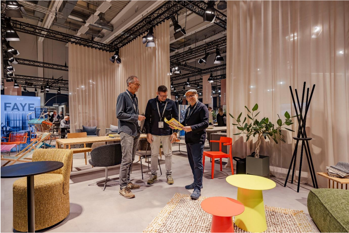
Interior Insights 2024: Starke Marken für design-orientiertes Einrichten auf 1.500 qm.