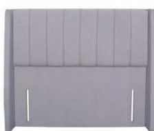
Balmoral 141 cm (B) / 6 cm (T)