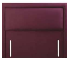
Magnolia 141 cm (B) / 6 cm (T)