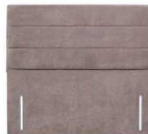
Lavender 141 cm (B) / 6 cm (T)