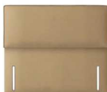
Penshurst 120 cm (B) / 6 cm (T)