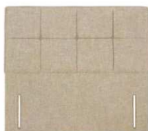
Cassia 141 cm (B) / 6 cm (T)