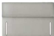
Primrose 100 cm (B) / 6 cm (T)