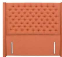
Blossom 141 cm (B) / 6 cm (T)