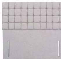
Windsor 141 cm (B) / 6 cm (T)