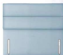
Carnation 120 cm (B) / 6 cm (T)