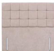
Jasmine 141 cm (B) / 6 cm (T)