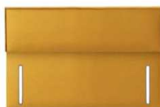
Wye 100 cm (B) / 6 cm (T)