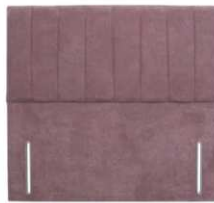
Daisy 141 cm (B) / 6 cm (T)