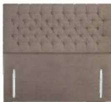
Chesterfield 141 cm (B) / 6 cm (T)